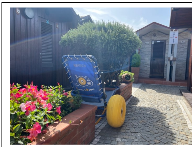
Sedia da mare tipo job